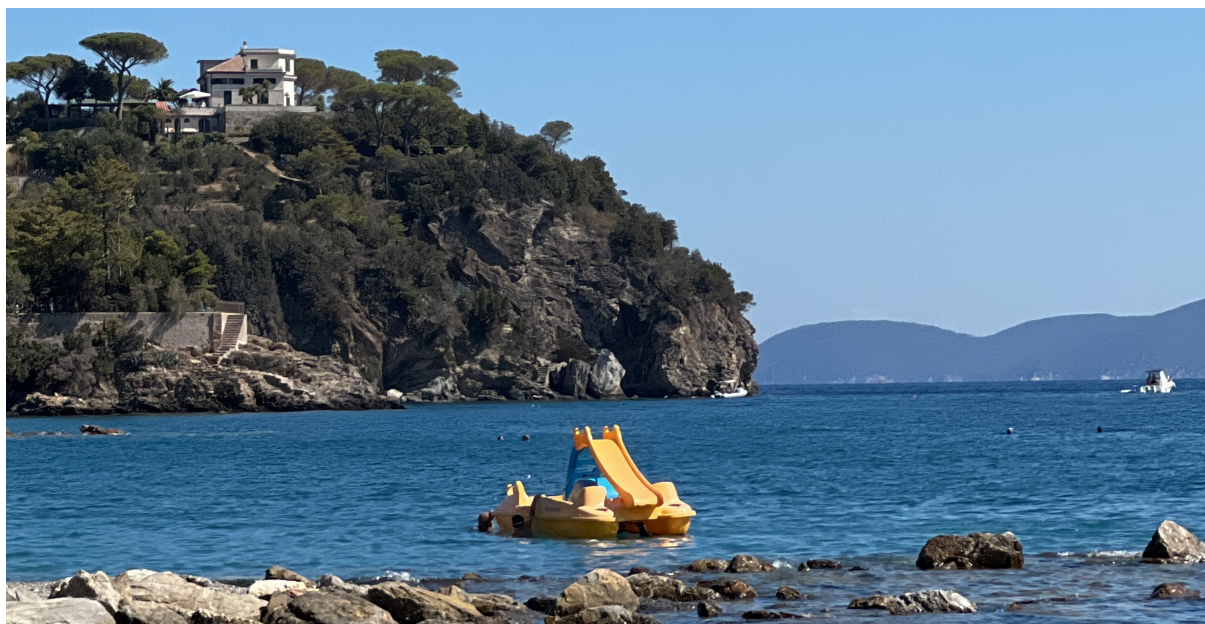
Vista verso nord

D omenica 31 Luglio 2022, giornata in spiaggia con la famiglia a Cavo, Isola d'Elba. Solitamente nel weekend ci sono parecchi attivatori in giro e la posizione della spiaggia è ben esposta verso Toscana e Lazio, un collegamento verso le Apuane o il monte Amiata dovrebbe essere fattibile anche con un semplice palmare FM.